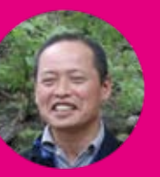
モーリー (企画・アテンド)