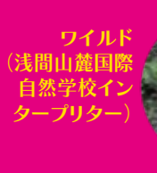
ワイルド (浅間山麓国際 自然学校イン タープリター)