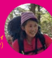
コマツティ (スタッフ)